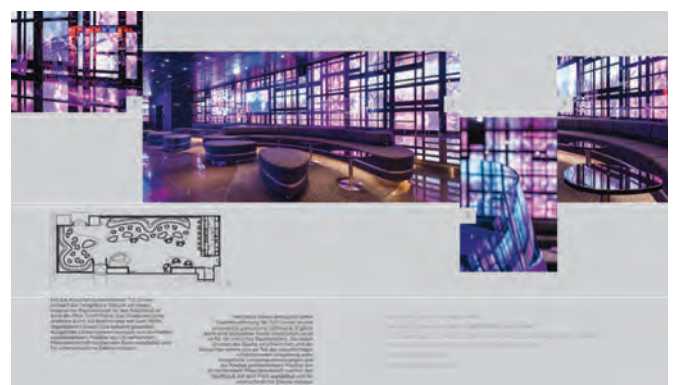
Auf dem Meer 2