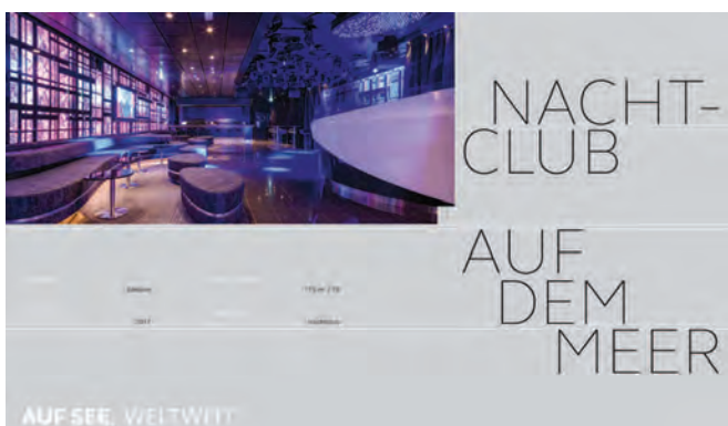
Auf dem Meer